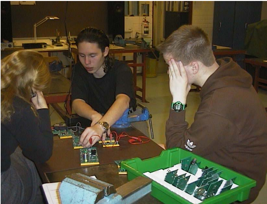
Kuva 3. Minä hallitsen tämän homman vaikka noi toiset väittää jotain muuta.