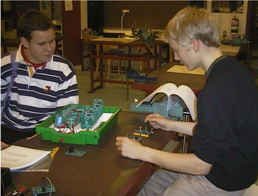
Kuva 3. Mitä sinä oikein yrität, ei se varmaankaan mene noin.