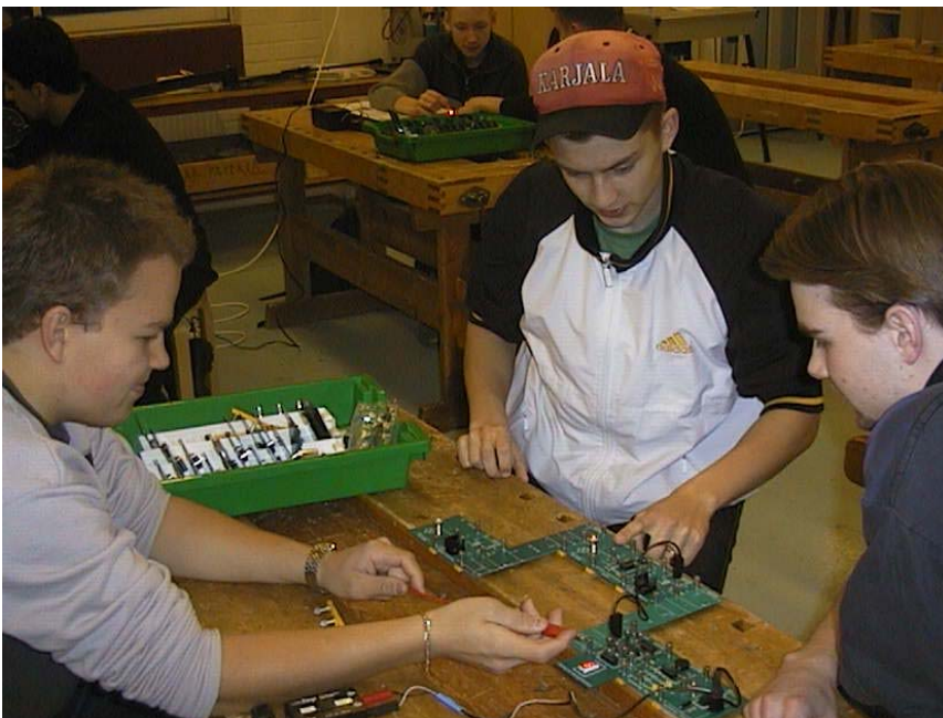
Kuva 2. Kyllä me pojat hoidellaan tämä asia niin, että virta kulkee oikein